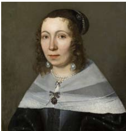
Jacob Marrel, Bildnis der Maria Sibylla Merian, 1679

Aus Anlass des Internationalen Frauentags am 8. März würdigen die „Gorbitzer Nachrichten“ drei bewundernswerte Naturwissenschaftlerinnen. Es ist hilfreich, dass es so prominente Frauen gibt, doch öffentliche Bekanntheit oder eine große Karriere sind nicht unbedingt notwendig dafür, sich für Frauenrechte und Gleichberechtigung einzusetzen. Wir können bei uns selbst beginnen, in der Familie, im Freundeskreis, im Alltag, bei der Kindererziehung, mit Zivilcourage und durch Solidarität. Einen ganz herzlichen Glückwunsch zum Frauentag ihnen – liebe Leserinnen – in Gorbitz und überall.