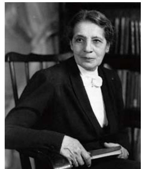
Lise Meitner, 1878-1968.

gen ihren Namen. 1879 wurde Amalie Dietrich Leiterin einer Sammlung im Botanischen Museum von Hamburg. Im Amalie-Dietrich-Museum in Siebenlehn können originale Herbarien und ausgestopfte Tiere betrachtet werden. Öffnungszeiten: Sonntags 14 bis 16 Uhr.