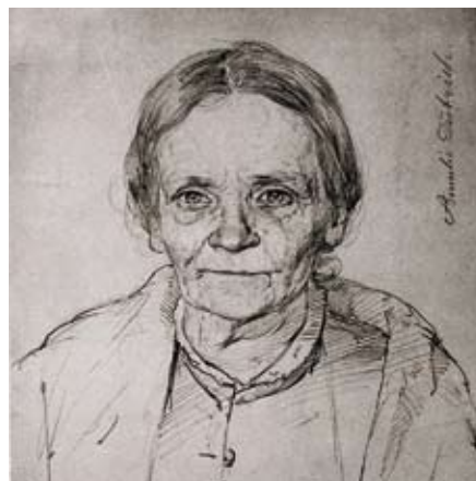
Amalie Dietrich, gezeichnet von Christian Wilhelm Allers, 1881